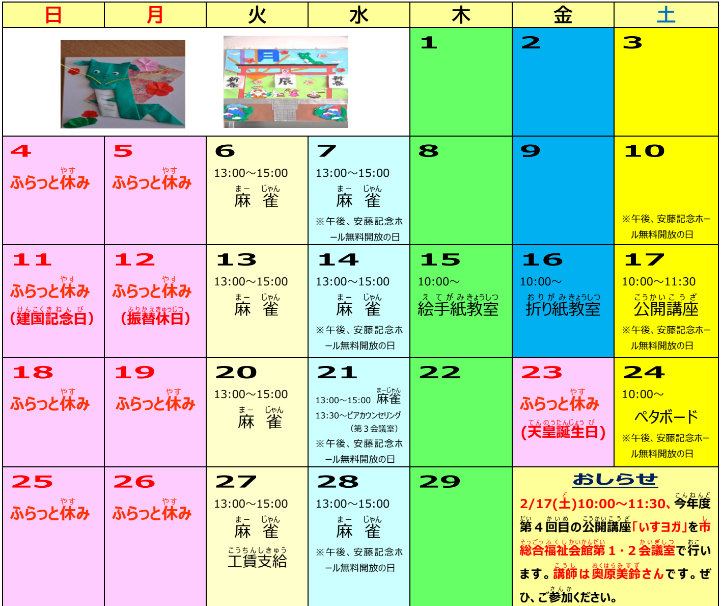
りようしゃ さくひん 利用者のみなさまの作品